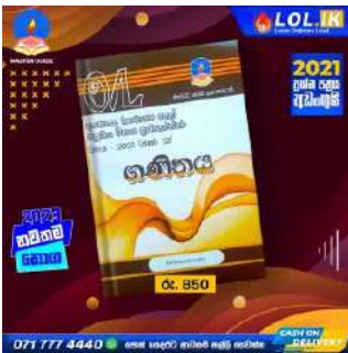
O/L Mathematics Past Paper Book – Master Guide