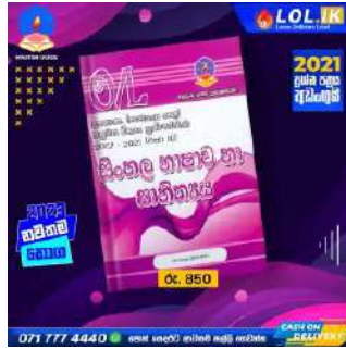
O/L Sinhala Language Past Paper Book – Master Guide