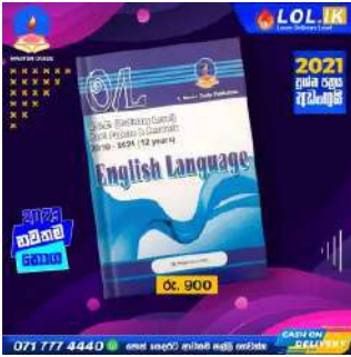
O/L English language Past Paper Book – Master Guide