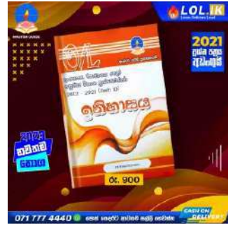
O/L History Past Paper Book – Master Guide