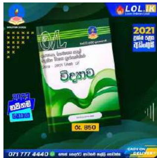
O/L Science Past Paper Book – Master Guide