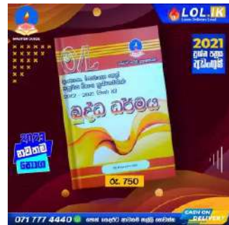
O/L Buddhism Past Paper Book – Master Guide