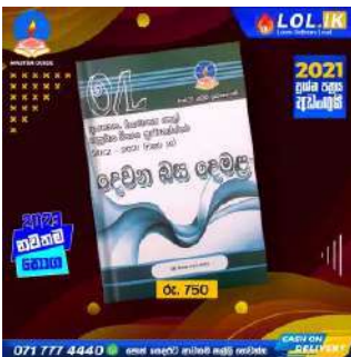
O/L Second Language Tamil Past Paper Book – Master Guide